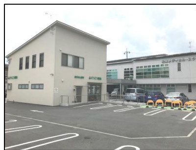
そうごう薬局 京都松尾店