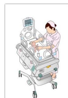
FIGURE 3 保育器(医機連)