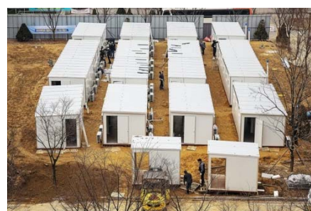
FIGURE 2 コンテナ病床